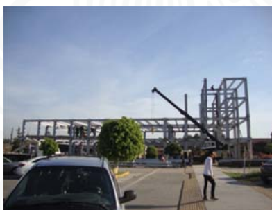
5 Abril 2017