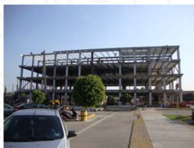
30 Mayo 2017