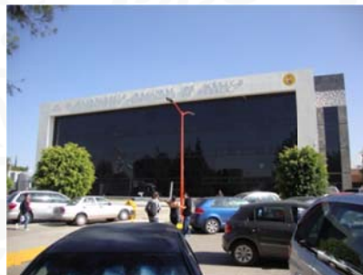
2 Septiembre 2017

Av. Tecnológico 420 Col. Maravillas. Puebla, Pue. C.P. 72220. Tels. (222) 229 88 10, 11, 12. 89 y 69.