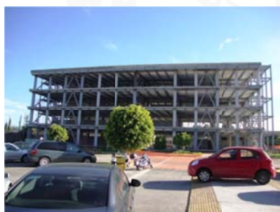
8 Junio 2017