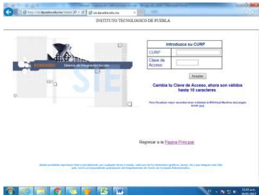
Fig. 8. Acceso al SIE de aspirantes.