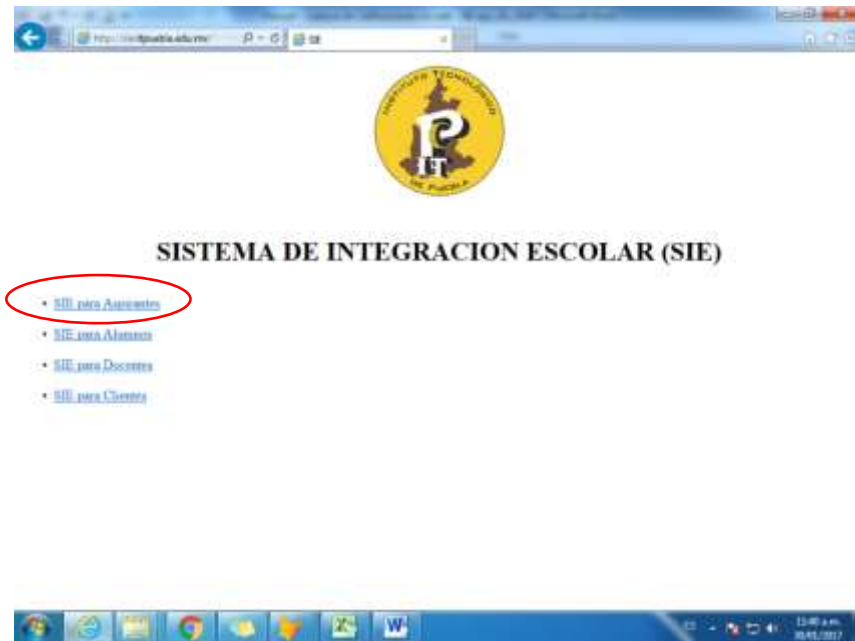
Fig. 7. Página electrónica del Sistema de Integración Escolar (SIE)